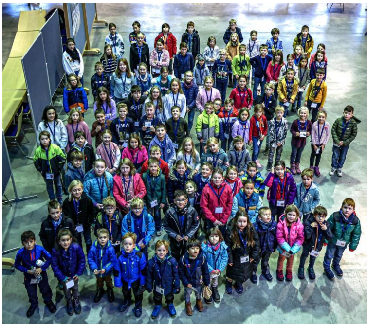
(1) 100 Kinder waren beim Bauer-Mitarbeiterkindertag dabei.